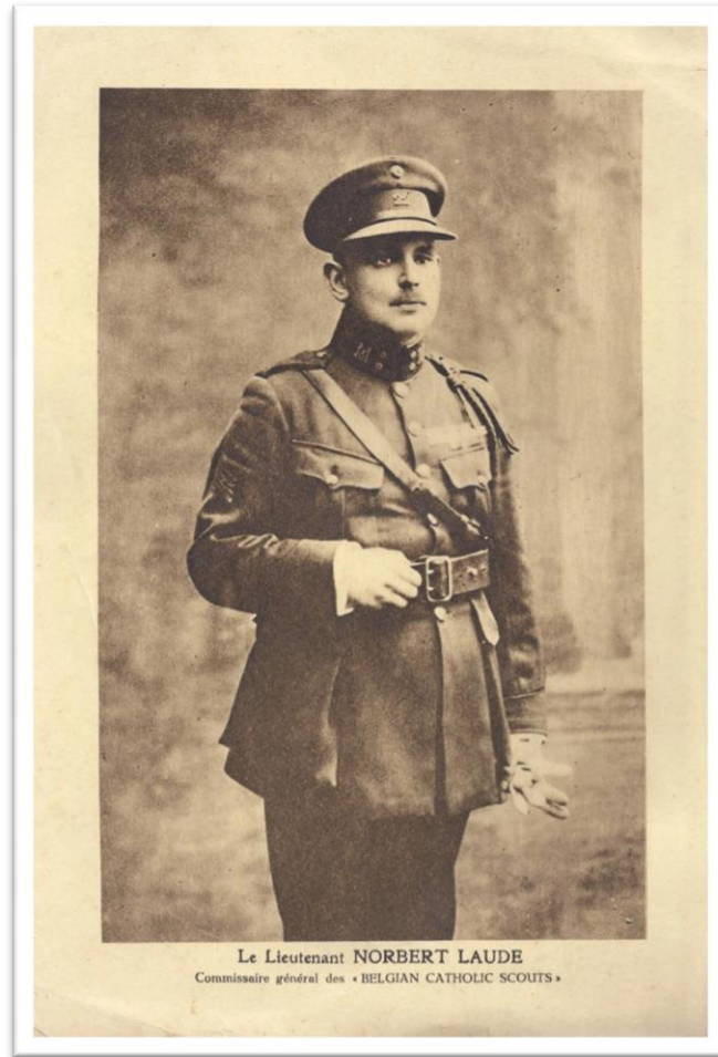
Afb. 3: Portret van Norbert Laude, algemeen commissaris van de Belgian Catholic Scouts (1920).

Tilman, die onderzoek deed naar het ontstaan van de katholieke padvinderij in België en in Congo, sloot het profiel van Laude perfect aan bij dat van de pioniers van de katholieke scouting. 110